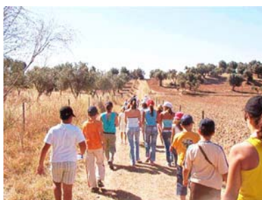
Figueira e Barros—Dia 9