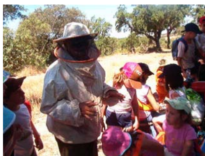
Aldeia Velha—Dia 10