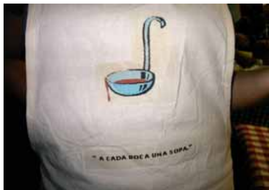
Os aventais da Associação :