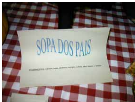
Ingredientes da Sopa dos Pais (cebola, nabo, abóbora, courgete, cebola, alho, batata e tomate)