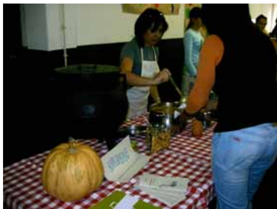
A mesa da sopa da Associação de Pais

Feira das Sopas - 16 de Outubro de 2007 na Escola